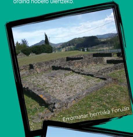
Erromatar herriak Foruan

Gernikako hiribildua, Lumoko elizatea, Kosnoagako kastroa, Urdaibaiko dorretxea, Atxetako koba eta Foruko erromatar herriak dira, besteak beste, eskualde honetako historiaren elementu nagusiak. Elementu horien guztien ondotik igarotzen da ibilbidea, iraganera bidaia egiteko aukera aparta, oraina hobeto ulertzeko.