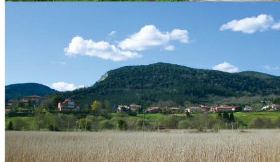
Foruako bistak itsasadarretik