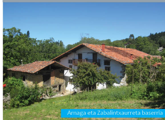
Arnaga eta Zabalintxaurreta baserria

Urdaibaiko Biosfera Erreserbako Patronatua Madrariaga dorretxea 94 403 23 60