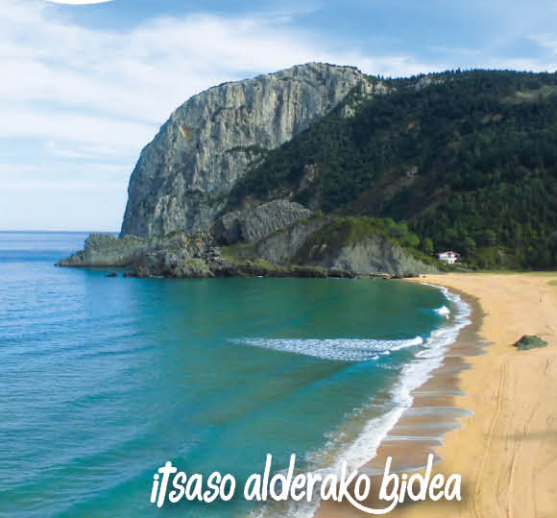
itsaso alderako bidea