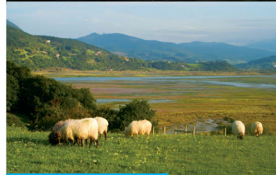
Busturiako landazabala eta padura